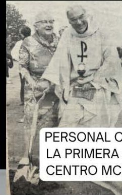
PERSONAL COLOCANDO LA PRIMERA PIEDRA DEL CENTRO MCEWAN, 1978