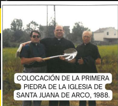
COLOCACIÓN DE LA PRIMERA PIEDRA DE LA IGLESIA DE SANTA JUANA DE ARCO, 1988.