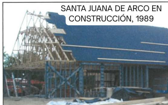
SANTA JUANA DE ARCO EN CONSTRUCCIÓN, 1989