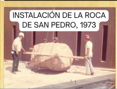
INSTALACIÓN DE LA ROCA DE SAN PEDRO, 1973