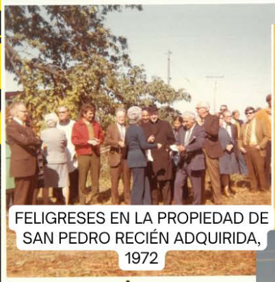
FELIGRESES EN LA PROPIEDAD DE SAN PEDRO RECIÉN ADQUIRIDA, 1972