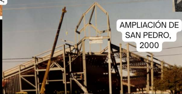
AMPLIACIÓN DE SAN PEDRO, 2000

Comparte tus experiencias de construcción con nosotros: