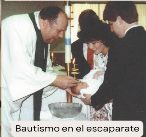
Bautismo en el escaparate

La diócesis cedió 18 acres a lo largo de Liberty Road a la iglesia de Santa Juana de Arco para que fuera su futura sede, pero la construcción de un nuevo templo aún tardaría años. Al principio, las misas dominicales se celebraban en un local comercial del centro comercial Olde Sawmill Square.