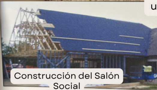
Construcción del Salón Social