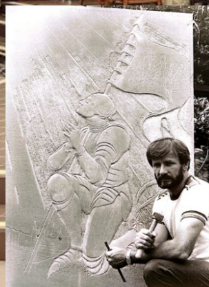
El artista Delay talla

La primera misa se celebró el 18 de julio de 1987 y continuó hasta la finalización de la iglesia actual. La nueva iglesia fue consagrada en noviembre de 1989 con la misa oficiada por el obispo Griffin y el padre George Schlegel. La placa conmemorativa se encuentra en el vestíbulo, en la pared izquierda al entrar a la iglesia.