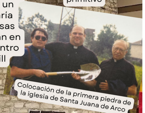
Colocación de la primera piedra de la iglesia de Santa Juana de Arco

La primera misa se celebró el 18 de julio de 1987 y continuó hasta la finalización de la iglesia actual. La nueva iglesia fue consagrada en noviembre de 1989 con la misa oficiada por el obispo Griffin y el padre George Schlegel. La placa conmemorativa se encuentra en el vestíbulo, en la pared izquierda al entrar a la iglesia.