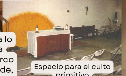
Espacio para el culto primitivo

La diócesis cedió 18 acres a lo largo de Liberty Road a la iglesia de Santa Juana de Arco para que fuera su futura sede, pero la construcción de un nuevo templo aún tardaría años. Al principio, las misas dominicales se celebraban en un local comercial del centro comercial Olde Sawmill Square.